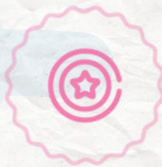
Pines de viaje