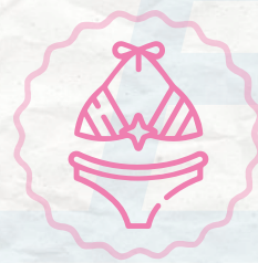
Vestido de baño