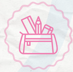
Kit Viajero (Cartuchera, Marcamaletas, Lapicero)