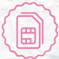
SIM card internacional