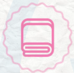
Toalla Playera microfibra